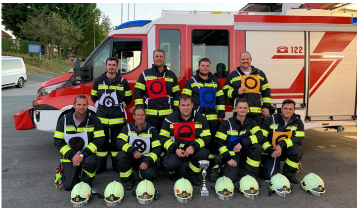
Branddienstleistungsprüfung in Bronze am 24. September