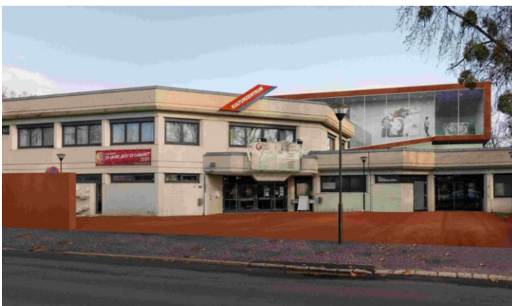
Entwurf für die Modernisierung des KUZ Güssing