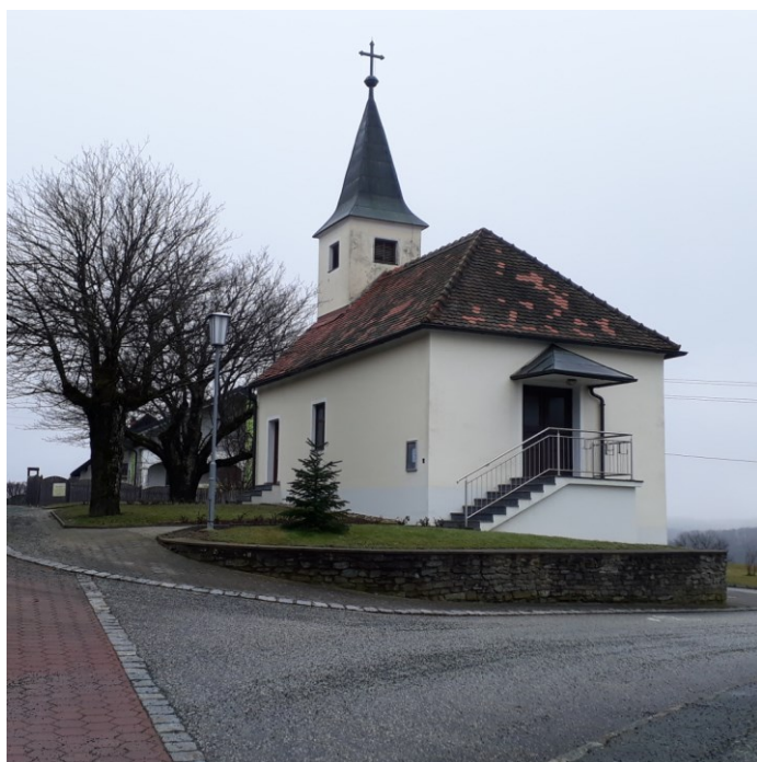
Kirche Kleinmürbisch im Seelsorgeraum „Göttliche Barmherzigkeit“