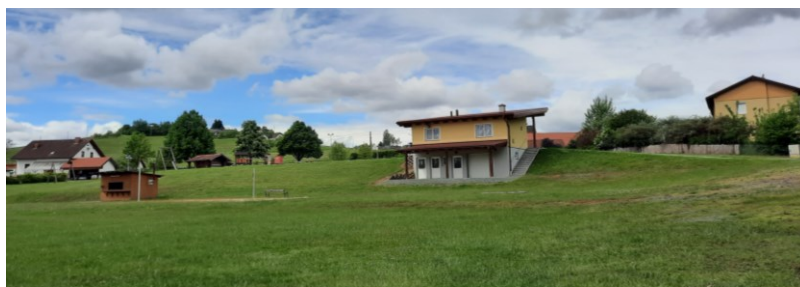
Die obigen Fotos zeigen den Container für Grasschnitt beim „Clubhaus“