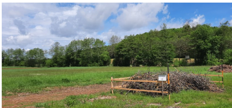
Sammelplatz für Strauchschnitt im „Dorf“ beim Sportplatz vis a vis „Pendl-Haus“