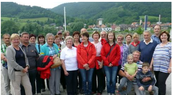
Gruppenbild vom Spielgemeinschafts-Ausflug in die Wachau