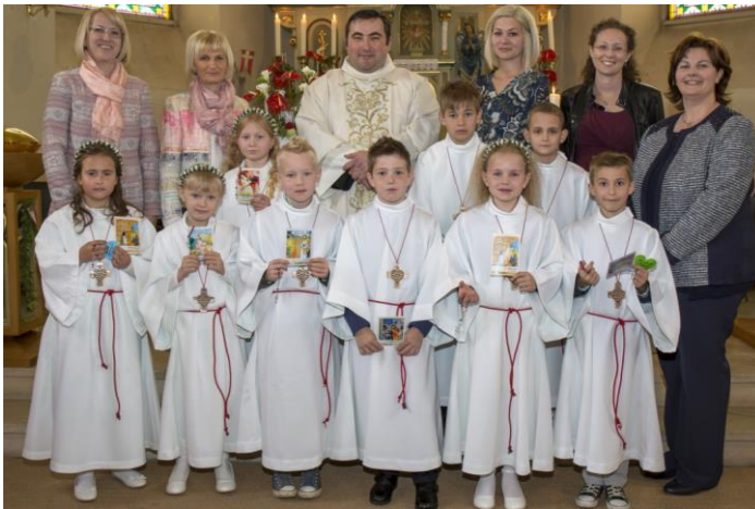
Gruppenfoto von der Hl. Erstkommunion am 24. April