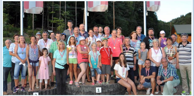
Die Teilnehmer beim ÖVP-Ausflug im August

Einen Tagesausflug zur Riegersburg und in den Freizeitpark Welten im Bez. Jennersdorf hat die ÖVP Kleinmürbisch am 14. August organisiert. Ca. 40 Teilnehmer, darunter etliche Kinder, haben bei herrlichem Sommerwetter einen schönen und vor allem sportlich-spannenden Ausflugstag erlebt.