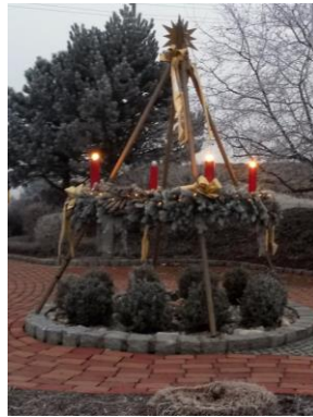
Der große Adventkranz