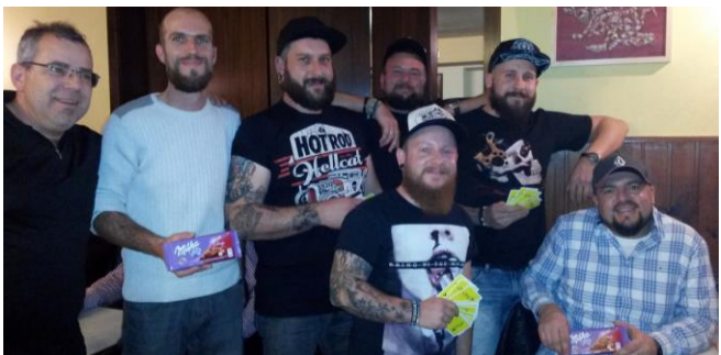
Beim Schnapsen des Vereins Blauforelle im Gh. Marth im Nov.