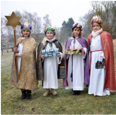
Die Sternsinger von Kleinmürbisch