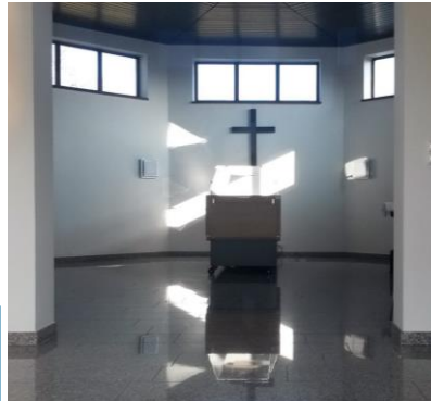
Innenansicht der Leichenhalle.