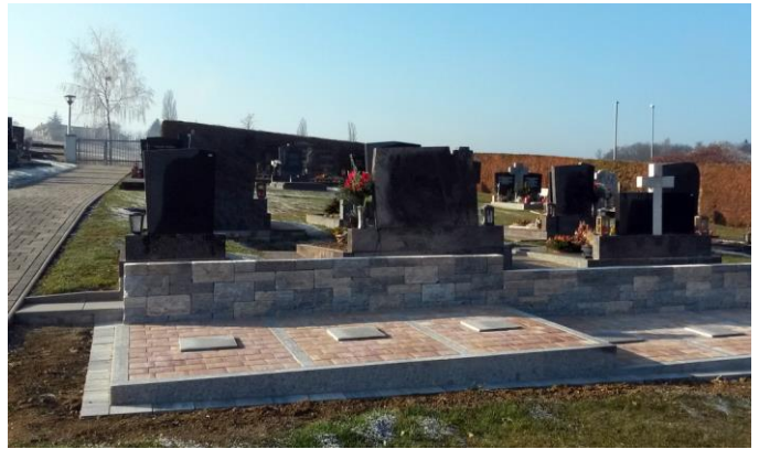
Der Platz für die Urnensäulen am Friedhof