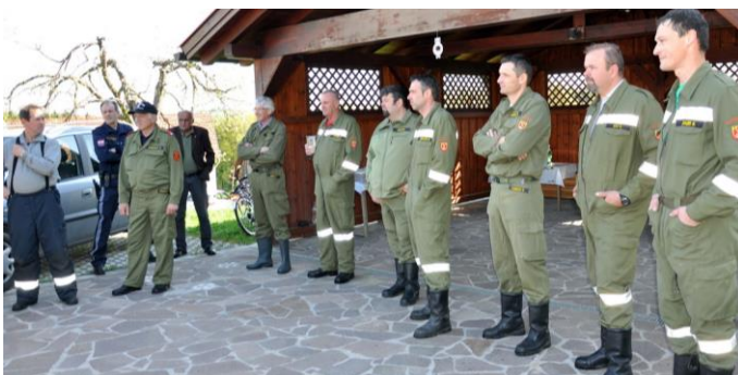
Inspektionsübung im April / Technische Leistungsprüfung in Eberau

Ein gut besuchter Frühschoppen mit der „Orig. Hügelländer Blasmusik“ wurde im Oktober veranstaltet.