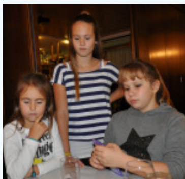
Auch die Kinder hatten Spaß beim Hendlschnapsen am 8. November