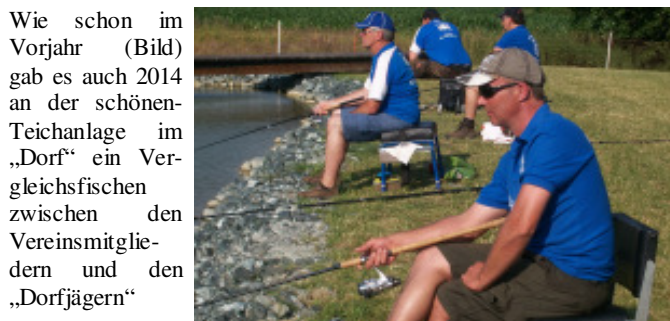
Wie schon im Vorjahr (Bild) gab es auch 2014 an der schönen Teichanlage im „Dorf“ ein Vergleichsfischen zwischen den Vereinsmitgliedern und den „Dorfjägern“