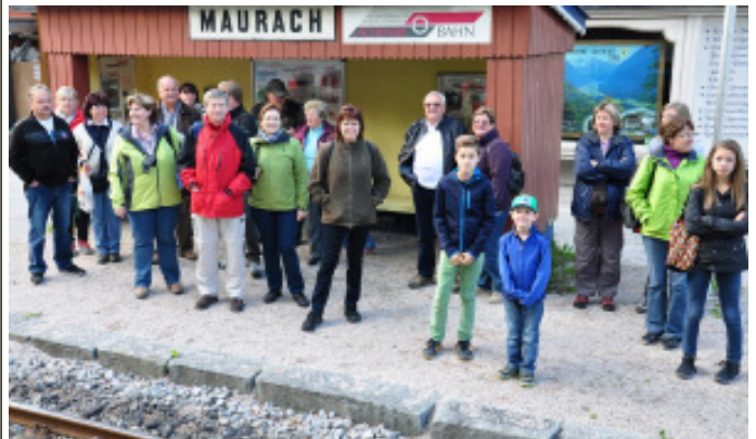
Die Teilnehmer am Tirol-Ausflug beim Warten auf die Dampfzahnradbahn und beim Ausstieg an der Haltestelle am Achensee (Seespitz).