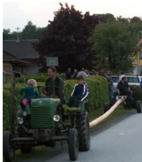
Tradition hat das Aufstellen des Maibaums am 30. April beim Gh. Marth