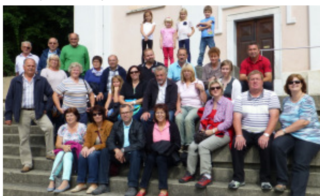
Die Teilnehmergruppe beim Kärnten-Ausflug in Griffen