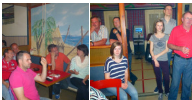
Gesellig war der Kegelabend im Gh. Vollmann in Neusiedl b. G.