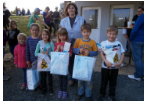
Lustig und spannend war die Ostereiersuche am 12. April