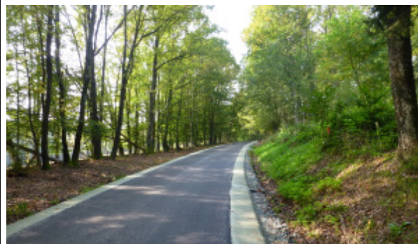
Der Güterwegeabschnitt nach Haus Nr. 13 (Fam. Weihs)