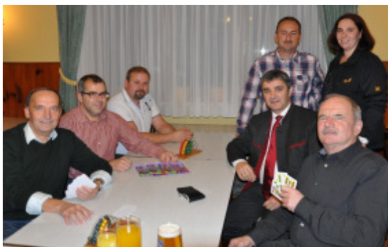
Beim Hendlschnapsen am 8. November im Gh. Marth