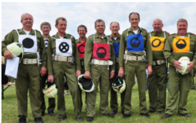
Die „Altersgruppe“ der Ortsfeuerwehr Kleinmürbisch beim Bezirksfeuerwehrleistungsbewerb am 21. Juni in Großmürbisch

An Einsätzen zu verzeichnen waren u. a. eine Personenbergung nach einer Kuhattacke, PKW-Unfälle und eine Suchaktion im Wald. Einige Feuerwehrrübungen und Ausfahrten sowie ein Frühschoppen am 26. Oktober (Nationalfeiertag) mit der Gruppe „Die Weltpartie“ rundeten das Feuerwehrjahr 2014 ab.