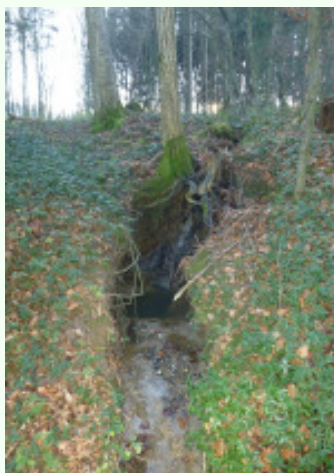
Tiefe Gräben riss das Wasser im „Graben“ Richtung „Dorf“

■ Nachdem durch die Oberflächenentwässerung im „Graben“ in einigen Wäldern schon ziemlich tiefe Gräben entstanden sind, hat der Gemeinderat im Oktober beschlossen, ein Waldstück von Thomas Kurz um 10.000 Euro anzukaufen. Hintergrund war, dass allfällig notwendige Sanierungsarbeiten Kosten von mehr als 100.000 Euro verursacht hätten (diesbezügliche Gespräche und Begehungen mit der Wasserbauabteilung gab es heuer bereits).