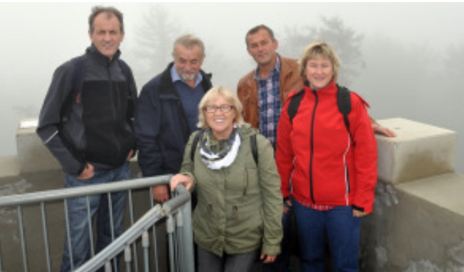
Auf der Aussichtswarte am Geschriebenstein bei Rechnitz