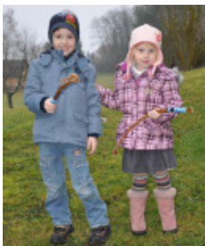
Zwei der "Auffrischer"