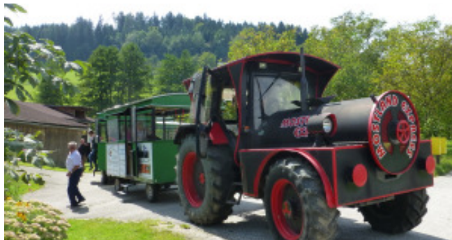
Der „Mostland-Express“ vom Granitztal