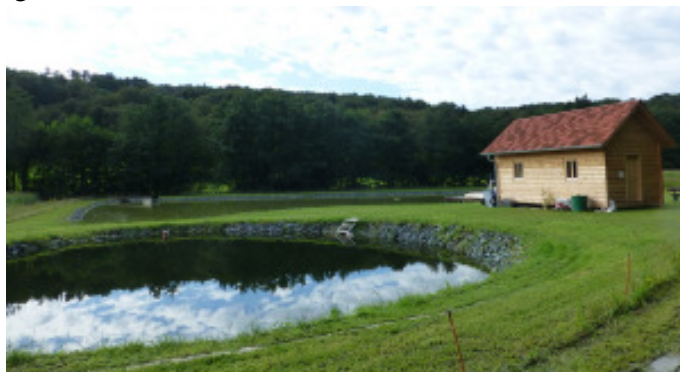
Die vom Inhaber und dem Verein gestaltete Teichanlage im „Dorf“