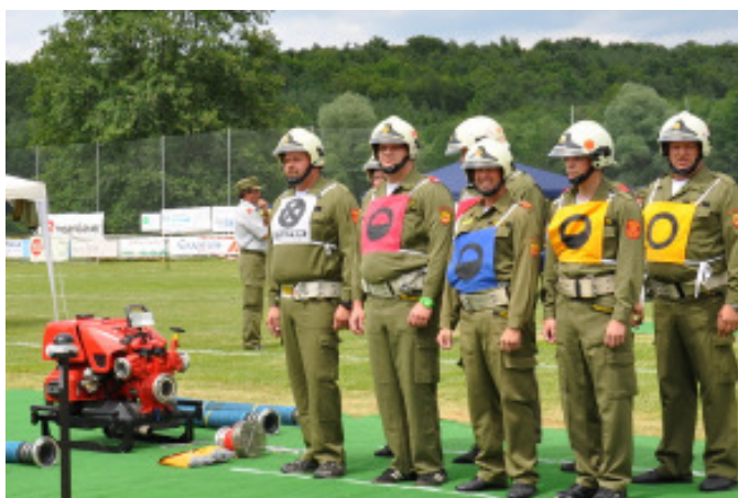
Die Kleinmürbischer Feuerwehr mit Kdt. Frühwirth Martin jun. (nicht am Bild) beim Bewerb Bronze A in Großmürbisch